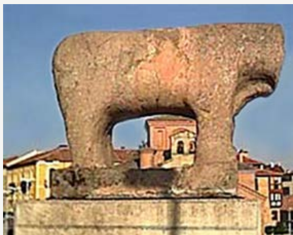
"y diome una gran calabazada en el diablo del toro, que más de tres días me duró el dolor de la cornada"

No es mi propósito analizar al detalle ningún pasaje más del Lazarillo en relación con Venegas, pero quiero sólo comentar algo sobre el topetazo que le propina el ciego a Lázaro contra el toro de piedra a la salida de Salamanca. Tal incidente no está inspirado sólo en la realidad, sino que tiene claras resonancias bíblicas. En concreto, debe relacionarse con el pasaje de los Salmos donde se nos dice “dichoso el que agarre a tus niños y los estrelle contra la roca” (“Beatus qui tenebit et allidet parvulos suos ad petram” Ps 137, 9). San Agustín comenta extensamente este pasaje en sus Enarrationes y concluye en su interpretación que el niño que nace para ser ciudadano de Jerusalén debe desoír las enseñanzas erróneas de sus padres y aplastar todo deseo pecaminoso contra la “roca de Jesucristo”. San Agustín había advertido un poco antes que los hijos de Jerusalén no deben vivir “en” o “dentro del río” de Babilonia, sino en su orilla [20] , pues ese río no es más que el efímero mundo de las apariencias. La relación de estos pasajes con el “nacimiento dentro del río” o el